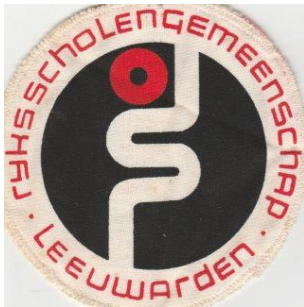
Logo voor sportevenementen